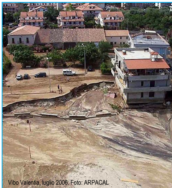
Vibo Valentia, luglio 2006.

Sebbene la relazione causa-effetto sia molto complessa, la variazione dell'uso del suolo gioca un ruolo importante nella variazione del ruscellamento; in particolar modo in piccoli bacini e in aree molto urbanizzate e antropizzate le modifiche del ciclo idrologico possono essere conseguenza della combinazione di fattori climatici e di fattori antropici.