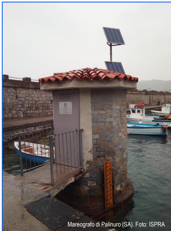
Mareografo di Palinuro (SA).

1. MATTM, 2023. Piano Nazionale di Adattamento ai Cambiamenti Climatici.