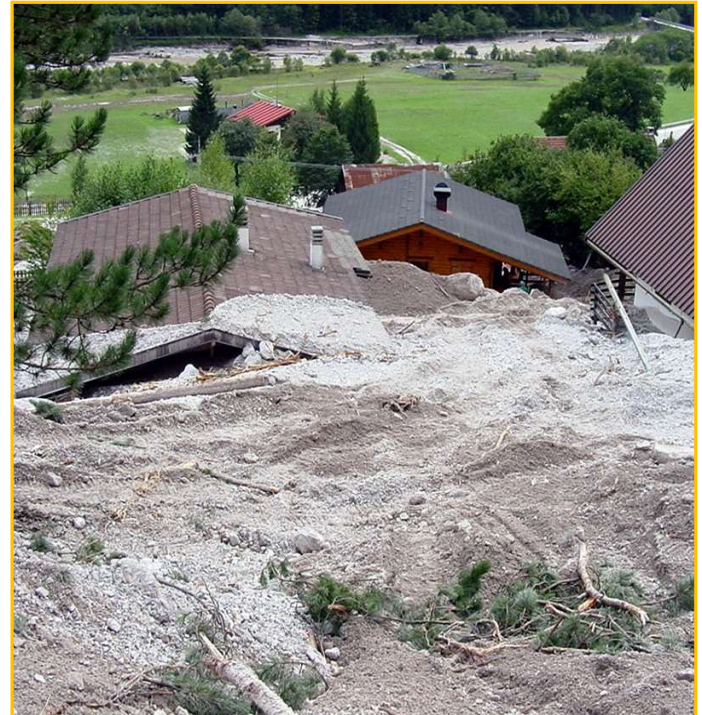
Colata detritica di Malborghetto-Valbruna (UD).

L'impatto dei cambiamenti climatici sull'insacco di frane è influenzato dalle condizioni naturali e antropiche locali, quali l'uso e copertura del suolo, e in particolare la percentuale di superficie impermeabilizzata.