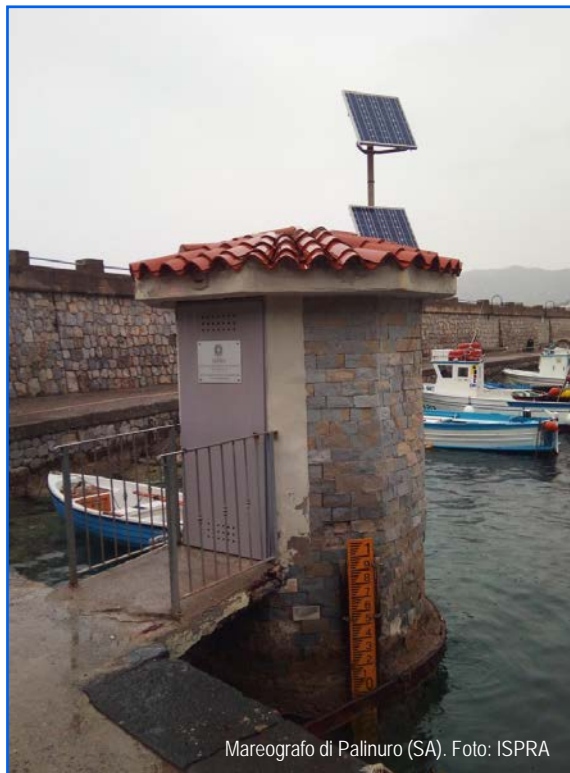
Mareografo di Palinuro (SA).

1. MATTM, 2023. Piano Nazionale di Adattamento ai Cambiamenti Climatici (Versione di Gennaio).